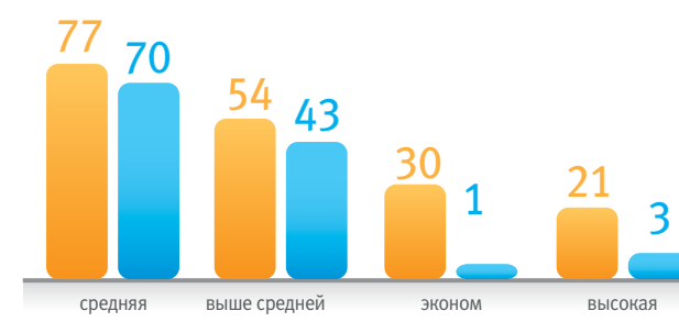
Ценовые категории товаров на выставке – «CJF – Детская мода-2012. Осень» (%)

какую ценовую категорию продукции представляют участники выставки