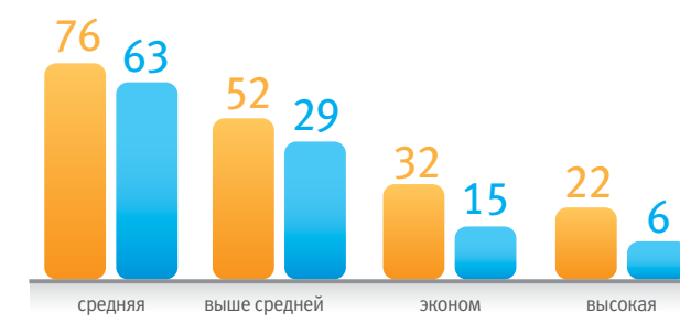
Ценовые категории товаров на выставке – «Мир детства-2012» (%)

какая ценовая категория продукции интересует посетителей